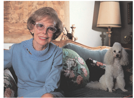
Anneliese Rothenberger als Violetta in Verdis «La Traviata» an der Staatsoper in Wien. Und heute mit ihrem «kleinen Gauner», dem Pudel Darko.

öffentlichen Auftritte ein abruptes Ende. Sie war krank. Diagnose: Darmkrebs. «Da habe ich mit allem abgeschlossen. Doch ich hatte Glück, die Operation und Genesungszeit verliefen optimal.» Angesichts der zehn Kilos aber, die sie in jener Zeit verlor, fehlte ihr danach einfach die Kraft zum Singen. «Ich sagte mir: «Jetzt reicht's. Ich hatte ein gutes Leben, Erfolg, einen fabelhaften Mann» – und freute mich über das Erreichte».